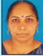
શ્રીમતિ ઉર્મિલાબેન પટેલ આચાર્ય ઉ. મા. શાળા