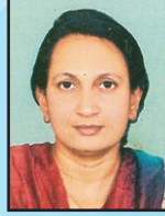
શ્રીમતિ અંજનાબેન પટેલ આચાર્ય પ્રાથમિક શાળા