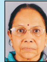
ડૉ. ઉર્વીશીબેન સુતરીયા કન્યા છાત્રાલય